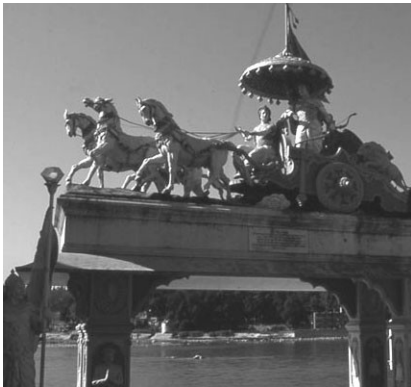
Krishna met zijn wagenmenner Arjuna

Het Mahabharata is, met 90.000 à 100.000 śloka 's 8 , waarschijnlijk het langste dichtwerk uit de wereldliteratuur. Het is voor het grootste deel ontstaan tussen de 4e eeuw v. Chr. en de 4e eeuw na Chr. Het beroemdste deel is zonder twijfel de Bhagavadgita 'godenlied', een werk van religieuze en ethische aard, een van de meest gelezen en hoogst gewaardeerde werken uit de Indiase literatuur.